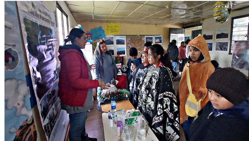
Imagen 1: OVS Itinerante en el Encuentro pedagógico: Explorando, el tejido, la ciencia y los saberes propios. I.E La Empalizada, Resguardo Indígena de Paletará.